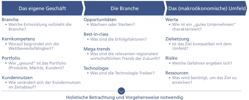
Abb. 6-6: Überblick Datensammlung und -analyse

Im zweiten Schritt müssen – basierend auf den Erkenntnissen aus der Datenanalyse aus Schritt 1 – potenzielle strategische Optionen identifiziert und grob detailliert werden. Eine beispielhafte Fragestellung könnte lauten: Welche Auswirkungen hat die Option, sich als Volumenhersteller für den filialisierten Handel auszurichten, auf Einkauf, Fertigung, Verkauf und Administration? Die Erörterung des Optionenraums erfolgt in der Regel über Workshops. Erste Ideen für strategische Optionen sollten dabei bereits in Schritt 1 in den Interviews grob abgeprüft werden, um ein erstes Feedback vom Markt in weitere Überlegungen mit einfließen zu lassen. Die Workshop-Ergebnisse sind abschließend mit dem Senior Management zu diskutieren und entsprechend auszuarbeiten.