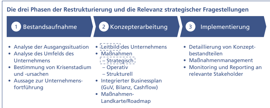
Abb. 6-3: Phasen der Restrukturierung

In der Praxis lässt sich die Restrukturierung eines Unternehmens stets in drei Phasen unterteilen, wie Abbildung 6-3 schematisch verdeutlicht.