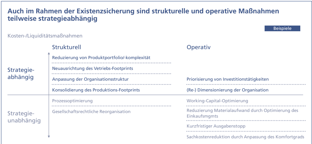
Abb. 6-5: Strategische Dimension struktureller und operativer Maßnahmen

Wenn ein Unternehmen sich in einer schweren Krise befindet, sind sowohl in struktureller als auch operativer Hinsicht akute Maßnahmen zur Verbesserung der Kostensituation bzw. zur Erhaltung der Liquidität notwendig. Strukturelle Maßnahmen, die strategieabhängige Fragestellungen beinhalten, sind z. B. die Reduzierung der Komplexität des Produktportfolios, die Neuausrichtung der Vertriebsorganisation, die Anpassung der Organisationsstruktur und die Konsolidierung des Produktionsprozesses. Hingegen sind Prozessoptimierung und die gesellschaftsrechtliche Reorganisation des Unternehmens grundsätzlich von der Unternehmensstrategie unabhängige strukturelle Fragestellungen.